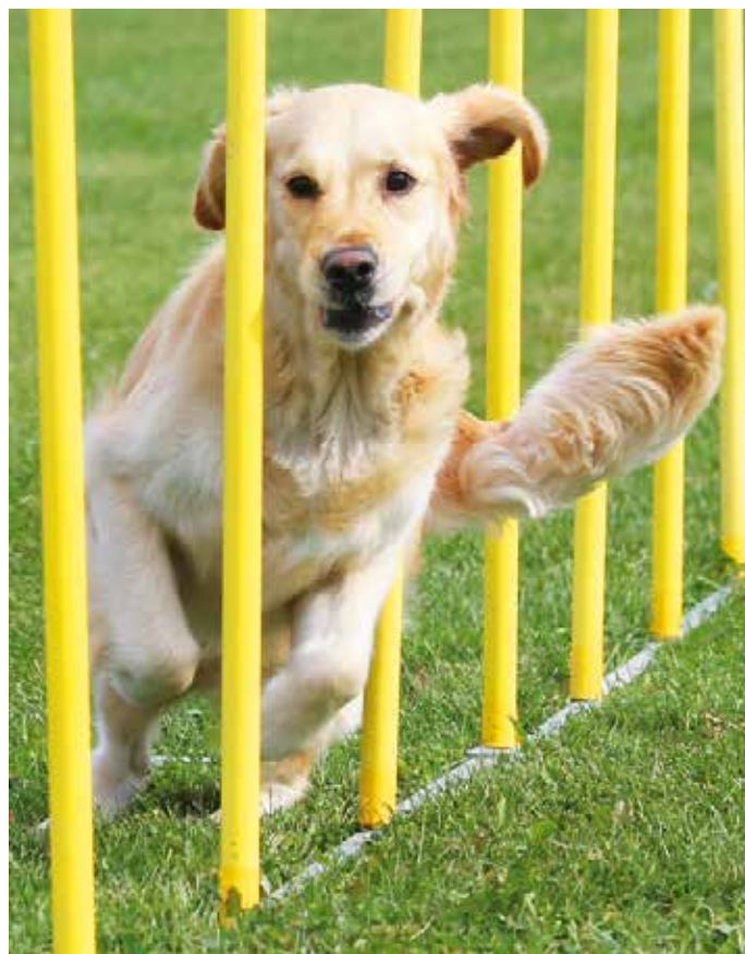
Flest klubbar har instruktörer för agility. Det är också i agility som de flesta klubbar önskar fler utbildade instruktörer.