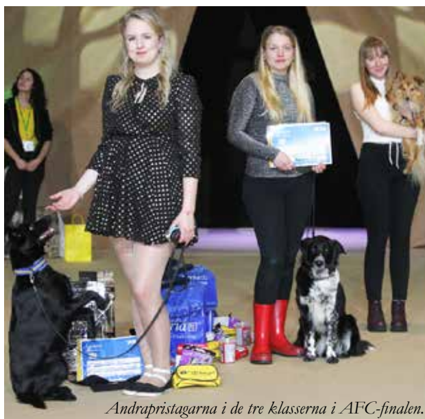
Andrapristagarna i de tre klasserna i AFC-finalen.