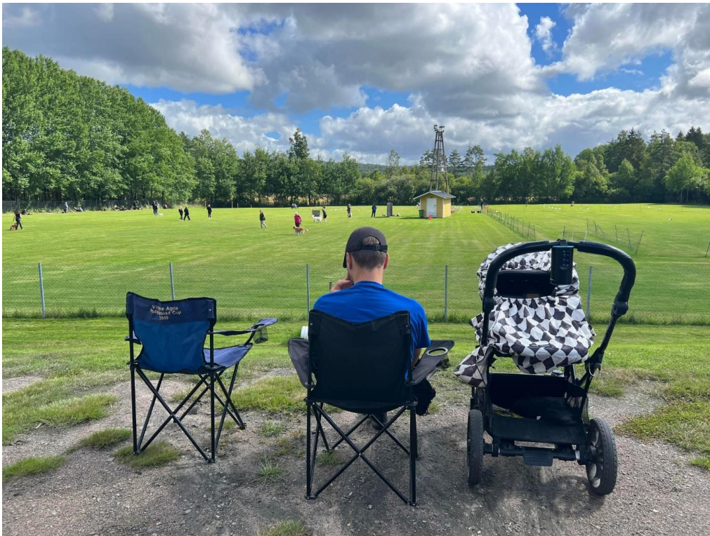
På plats på tävlingsplatsen.