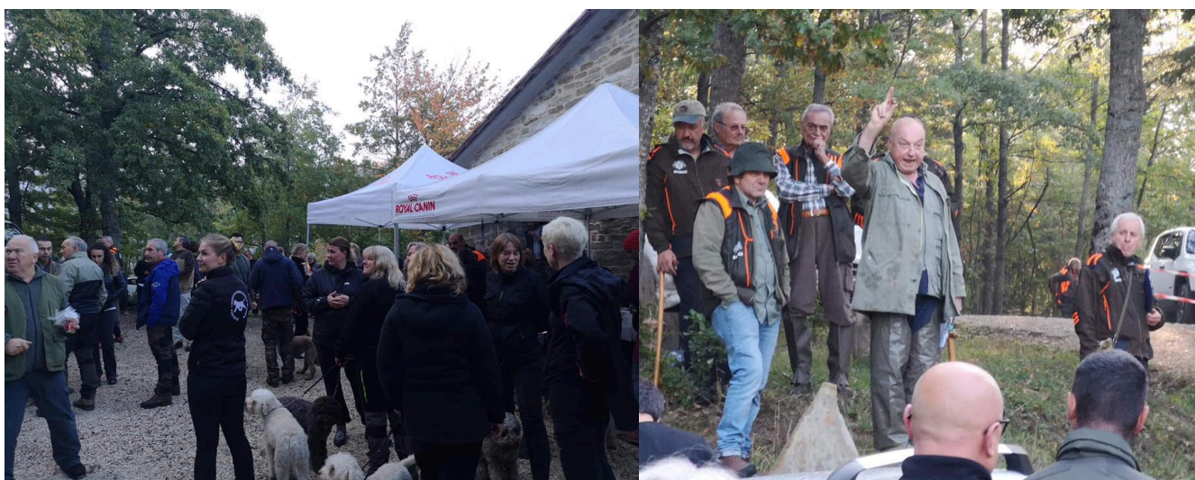
Samling inför söndagens tryffelprov