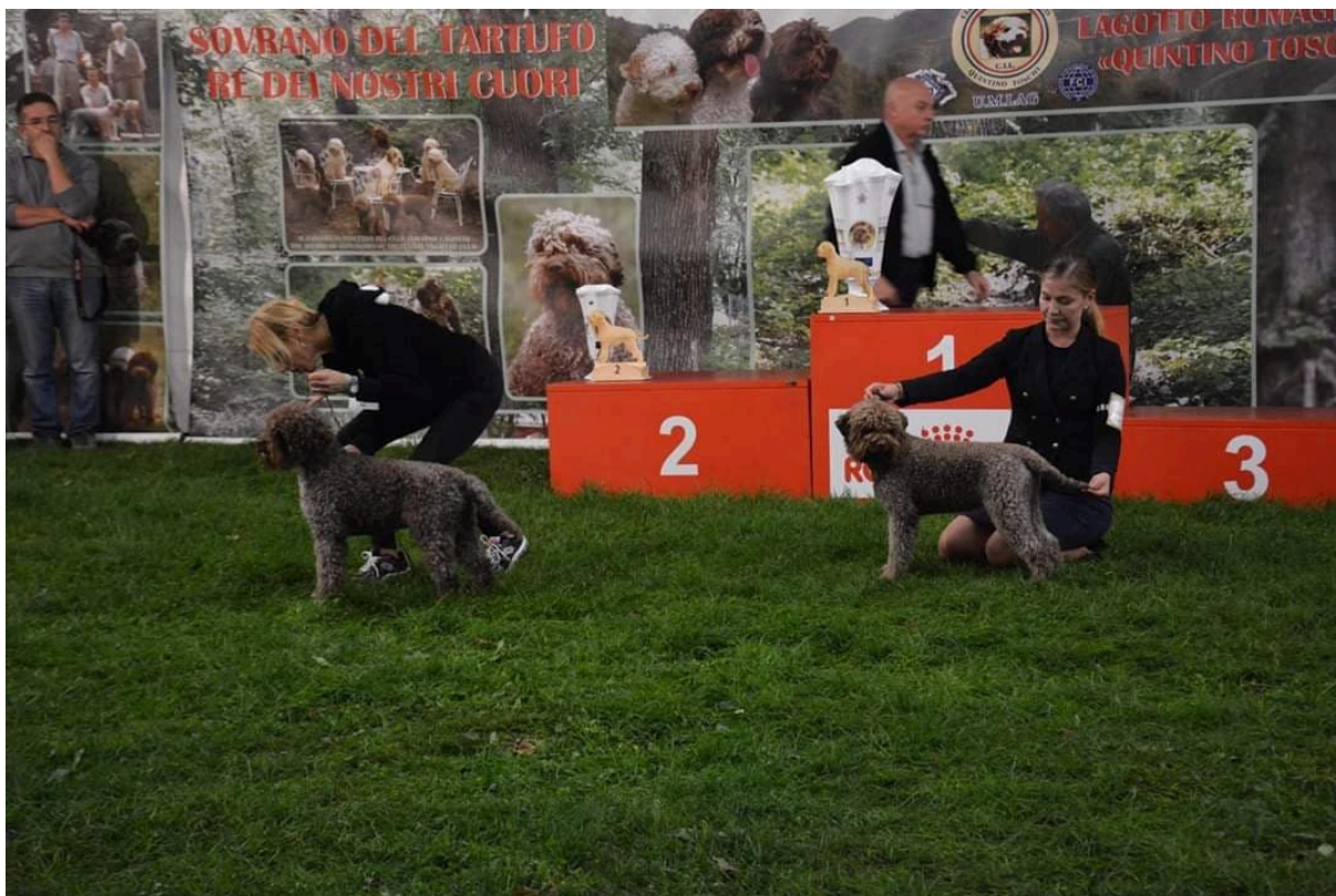
Dante Delle Gualdarie och Blixtra Contessa. Tävlan om Best in show.