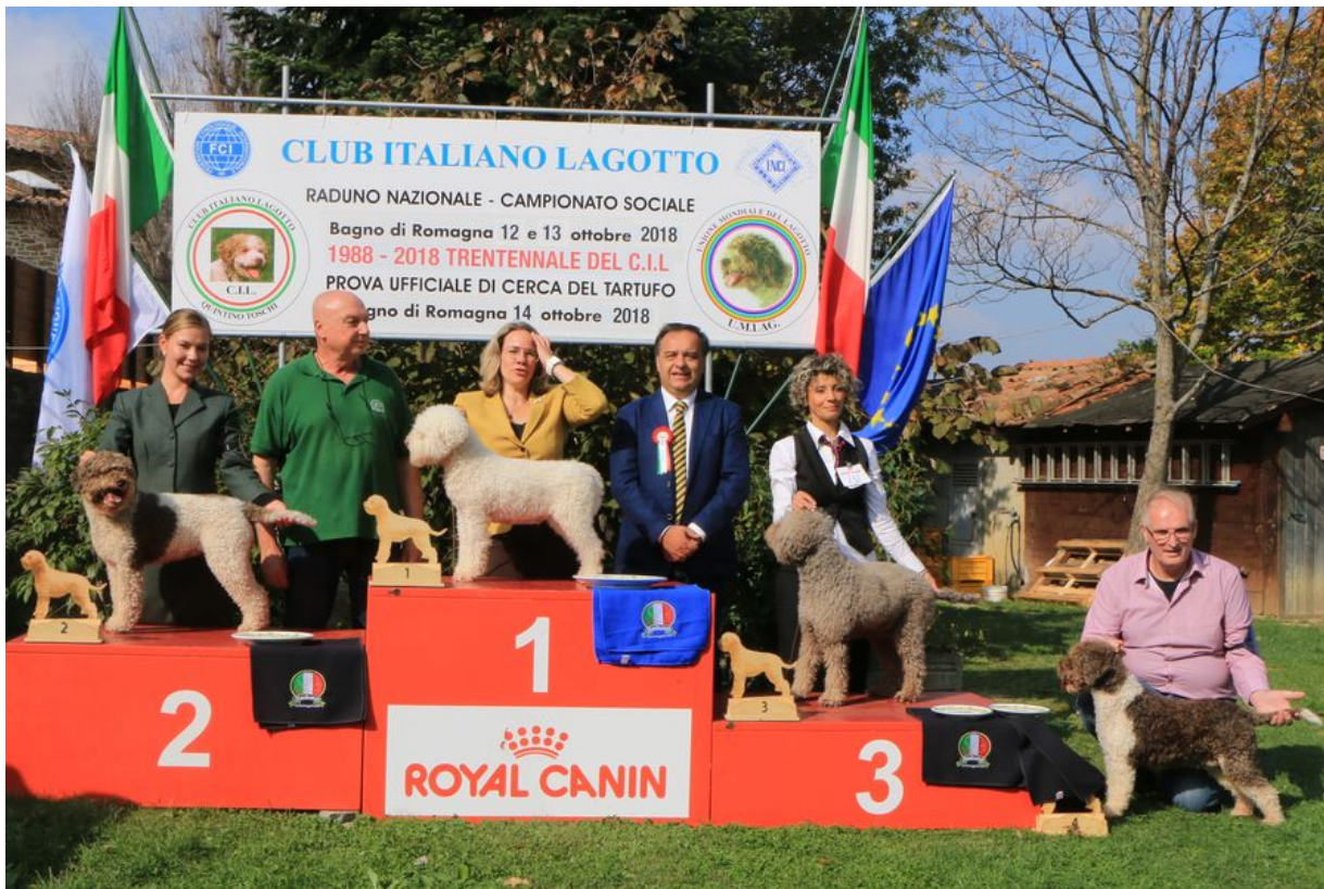
Blixtra Alberta 2a i veteranklass.