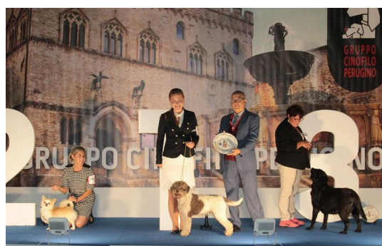
Blixtra Alberta BIS-veteran i Bastia Umbra

Första helgen var det dubbelutställning i Bastia Umbra, 56 respektive 31 lagotto var anmälda. Under helgen vann Majken R-CERT medan Berta slog till med att bli Best in show-veteran! Oj, vad glada vi blev. Nu hade nervositeten släppt lite - debuten i Italien var gjord och det gick ju bra.