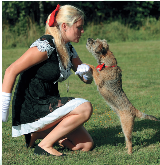
Det ekipage som har högst medelvärde av resultatet från två tävlingar under året vinner.