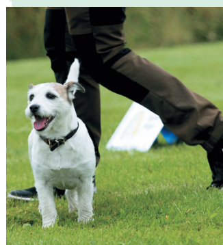
Det ekipage som har högst medelvärde från tre tävlingar vinner.