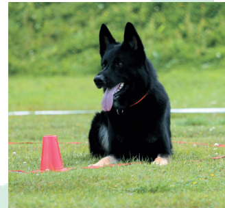
Det ekipage som har högst medelvärde från tre tävlingar vinner.