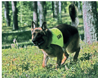
Det ekipage som har högst medelvärde (räknat i procent) från två brukstävlingar under året vinner.