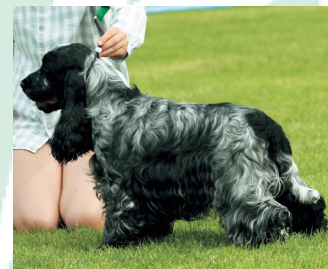
Här bestäms reglerna av Agria Junior Handling Cup. Du hittar dem på vår hemsida.

Årets Hundungdom är en tävling där Sveriges Hundungdom får chansen att uppmärksamma några av alla duktiga medlemmar som tävlar framgångsrikt i olika hundsporter. Oavsett vilken gren eller klass som du tävlar i kan du delta i Årets Hundungdom.