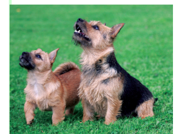
Norwichterrier är en av raserna som Svenska Terrierklubben ansvarar för.

Vissa dagar på jobbet blir man gladare än andra. En sådan dag ägde rum i början av november.