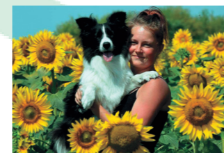
My Rosenholm och Issy blev ett starkare team under kennellägret i Ungern.

Jag lärde mig så mycket under resan. Jag och Issy har byggt upp vårt självförtroende när vi är bland fåren och har blivit ett starkare team. Vi är mer