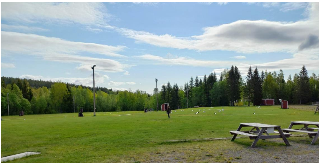
Tävlingsplatsen står redo med tre banor.