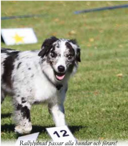
Rallylydnad passar alla hundar och förare!