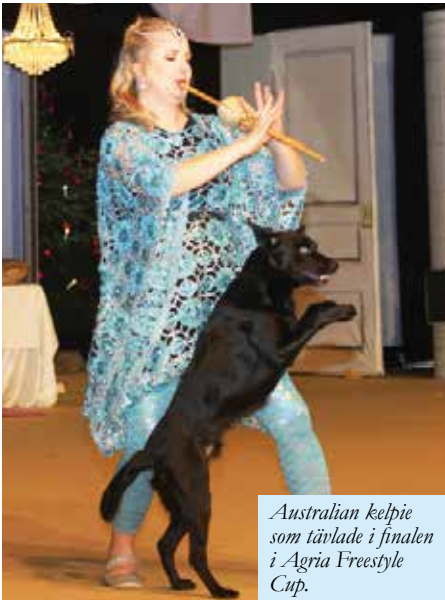
Australian kelpie som tävlade i finalen i Agria Freestyle Cup.

Är tävlingen som vill sporra ungdomar att tävla i junior handling. Alla mellan 10-17 år är välkomna och man tävlar på alla SM-uttagningstävlingar runt om i Sverige. Poäng samlas under året. Vinnaren får representera Sverige på en tävling utomlands.