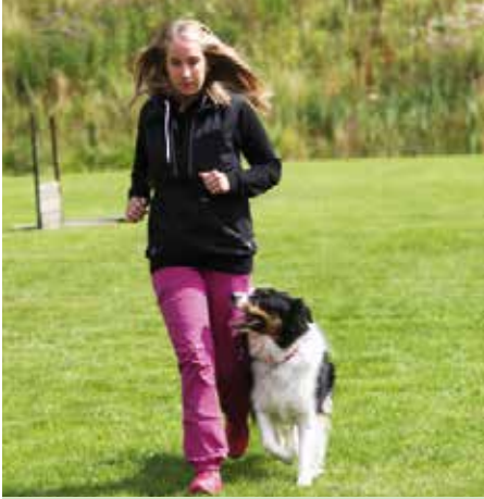
En följsam border collie tävlar i lydriad på högsta nivå.