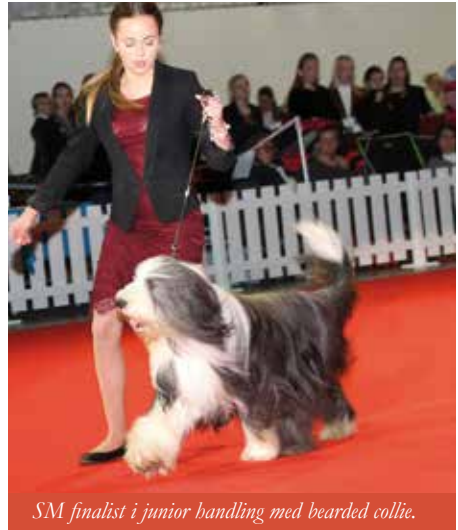
SM finalist i junior handling med bearded collie.

Våra klubbar anordnar tävlingar av både större och mindre slag. Framför allt är det lydriads-, rallylydriads-, freestyle- och agilitytävlingar. Tävlingar kan vara antingen officiella eller inofficiella. När en tävling är officiell så registreras hundens resultat i ett register hos SKK. De inofficiella tävlingarna är ofta klubb-tävlingar och mindre tävlingar som är jättebra att starta på som träning. Sveriges Hundungdom har rätt att arrangera officiella tävlingar i agility, lydriad, rallylydriad, heelwork to music och freestyle. Vi har också ansvaret för junior handlingtävlingar, dessa arrangeras i samband med SKK:s internationella utställningar och Nordic Dog Shows.