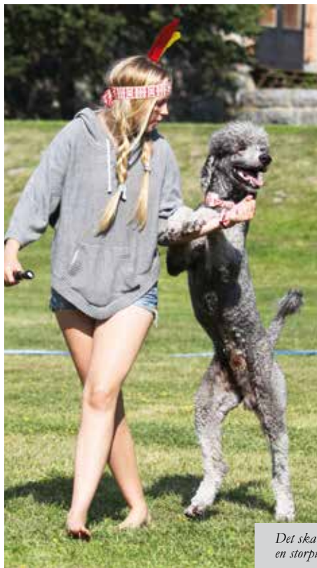
Det ska kännas lika roligt att tävla som att träna! Här syns en storpadel med sin matte som båda verkar gilla freestyle

Freestyle och heelwork to music är hundsporter som kommit till Sverige och Europa från USA och Kanada. Idag finns sporten i Norden och i många av Europas länder och den blir allt populärare. När sporten först kom till Storbritannien var den tänkt som pausunderhållning och uppvisning vid större hundutställningar. Man ville locka ungdomar att börja träna och tävla i lydning med sina hundar. Då var det främst varianten av freestyle som kallas för heelwork to music som gällde. Glädjen och samarbetet mellan förare och hund är mycket viktigt. Om du gillar musik, dans och hundar och om du och din hund dessutom gillar att showa och uppträda inför folk har du hittat helt rätt – freestyle!